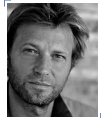
LAURENT DELAHOUSSE JOURNALISTE

« Le magazine STYLE&CO est un point d'ancrage pour moi. Ancrage dans ma région, la ville de mon enfance. J'aime m'y plonger à chaque fois que je le reçois à Paris. J'y découvre le dynamisme et les initiatives de jeunes créateurs qui vivent à Amiens et dans ses alentours. La presse locale est une richesse qu'il faut soutenir dans un contexte économique difficile. Alors bon anniversaire à toute l'équipe. »